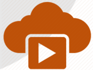
Video on Web