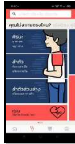
ภาพที่ 1 แอปพลิเคชัน DOCTOR ME เลือกดูอาการที่คุณต้องการ

ผู้วิจัยได้ศึกษาแอปพลิเคชันของ Doctor Me พร้อมนำแนวคิดนี้ไปพัฒนาเป็นแอปพลิเคชันเกี่ยวกับไตและช่วยให้คำแนะนำ ในการดูแลสุขภาพไตรวมถึงวิธีการป้องกันการเกิดโรคไต