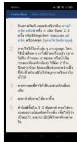
ภาพที่ 2 แอปพลิเคชัน DOCTOR ME แสดงวิธีการรักษา