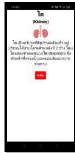
ภาพที่ 5 แสดงหน้าข้อมูลเกี่ยวกับไต