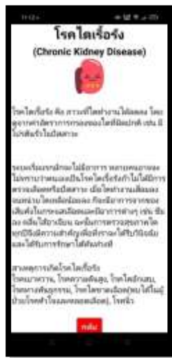
ภาพที่ 7 แสดงหน้าข้อมูลเกี่ยวกับโรคไตเรื้อรัง รวมไปถึงอาการต่างๆของโรค