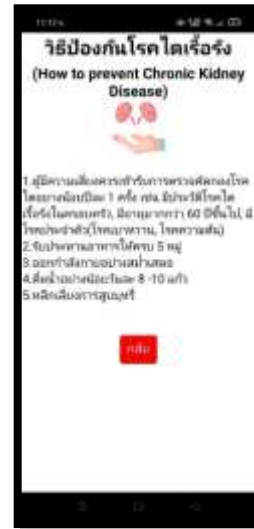
ภาพที่ 8 แสดงหน้าวิธีการป้องกันการเกิดโรคไตเรื้อรังเพื่อจะได้ป้องกันไม่ให้ตนเองนั้นเป็นโรคไต