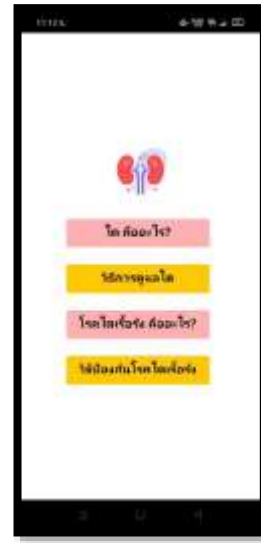
ภาพที่ 4 แสดงหน้าเมนูของ KIDNEY CARE ซึ่งผู้ใช้สามารถกดเข้าไปดูได้