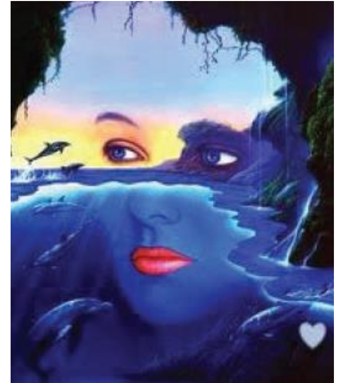
รูปภาพที่ 2.2 ประเภทของทัศนศิลป์