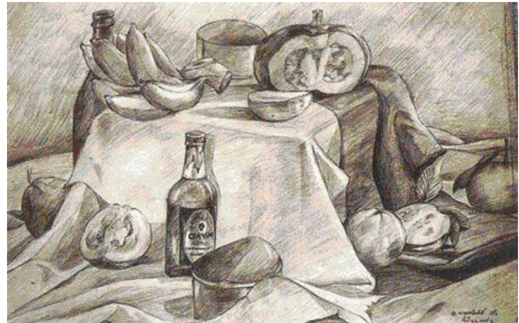
รูปภาพที่ 2.9 ภาพน้ำหนัก

5. น้ำหนัก คือ ค่าความอ่อนแก่ ของบริเวณที่ถูกแสงสว่าง และบริเวณ ที่เป็นเงาของวัตถุ