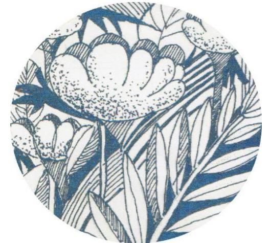
รูปภาพที่ 2.5 ภาพเส้น