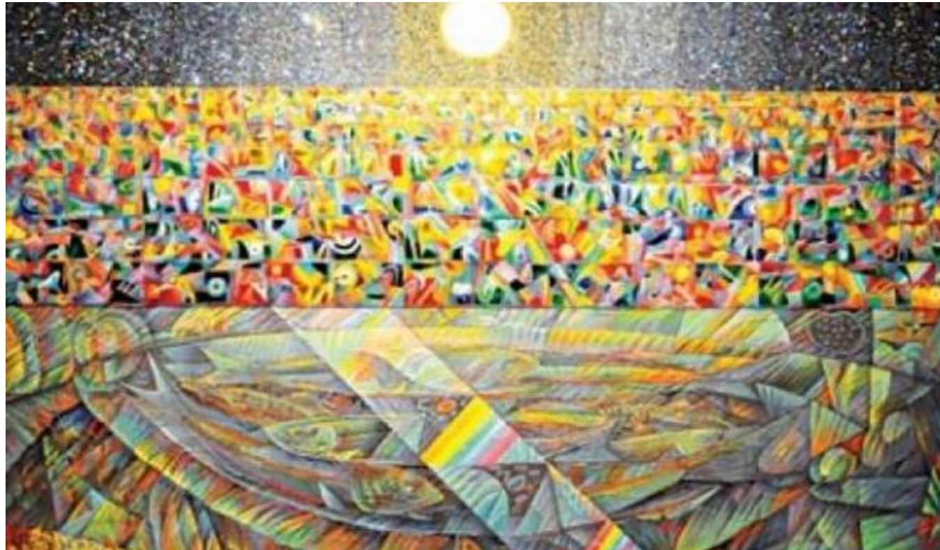
รูปภาพที่ 2.1 งานทัศนศิลป์