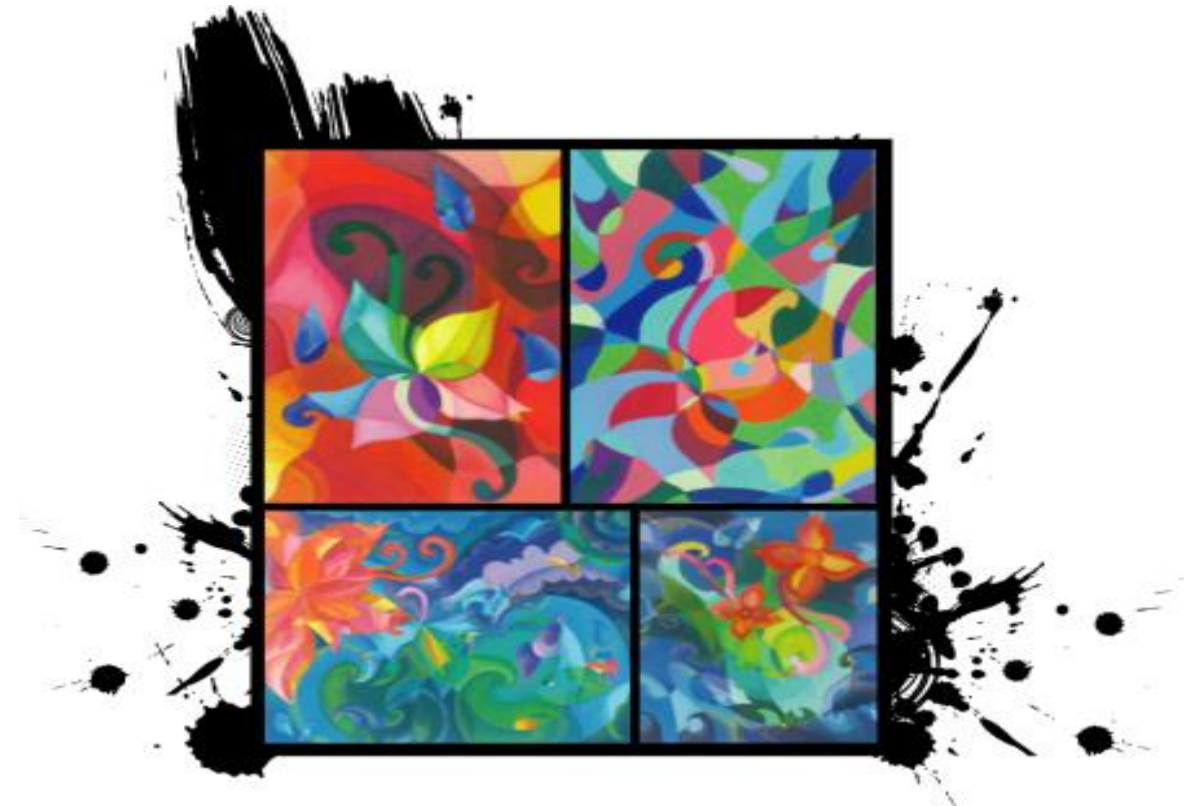
รูปภาพที่ 2.6 ภาพสี

3. สี คือ ลักษณะของแสงสว่าง ปรากฏแก่ตาให้เห็นเป็นสีขาว ดำ แดง เขียว น้ำเงิน เหลือง เป็นต้น ถ้าไม่มี แสงจะมองไม่เห็นสี