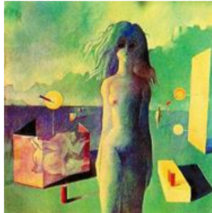
รูปภาพที่ 2.8 ภาพรูปทรง

4.2 รูปทรง คือ โครงสร้างของ รูป วัตถุ คน สัตว์ สิ่งของ มีลักษณะ เป็น 3 มิติ (กว้าง ยาว ลึก)