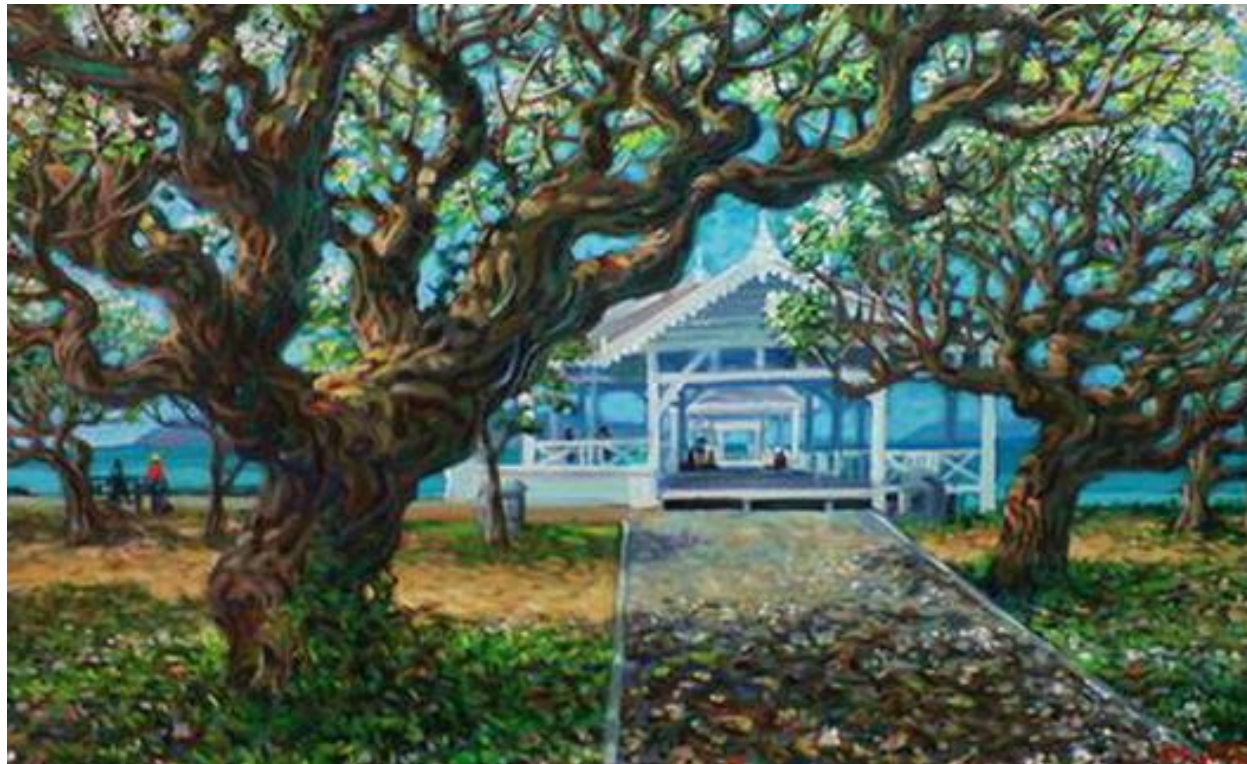
รูปภาพที่ 2.3 โครงสร้างทางทัศนศิลป์