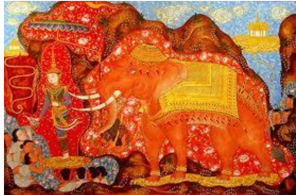
รูปภาพที่ 2.7 ภาพรูปร่าง

4. รูปร่าง คือ เส้นรอบนอกของ วัตถุ คน สัตว์ สิ่งของ มีลักษณะเป็น 2 มิติ (กว้าง ยาว)