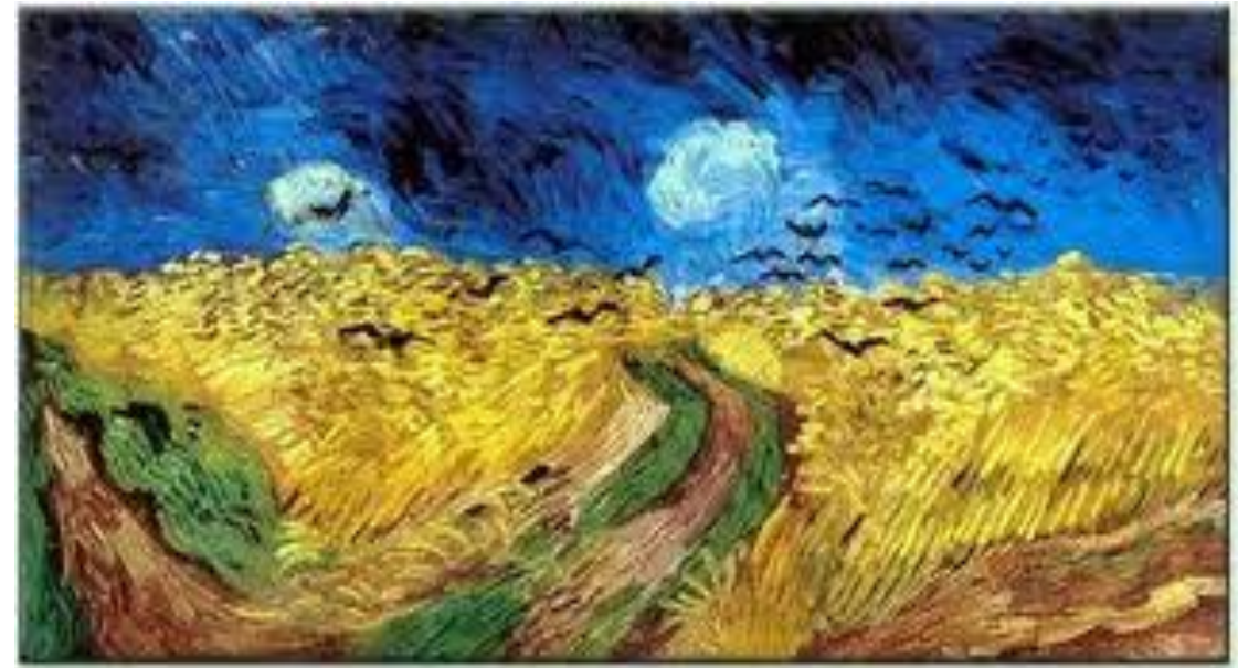
รูปภาพที่ 2.11 ภาพลักษณะ

7. ลักษณะ คือ ลักษณะภายนอกของวัตถุที่มองเห็นและสัมผัสพื้นผิวได้ แสดงความรู้สึกหยาบ ละเอียด ชรุขระ มัน ด้านเป็นเส้น เป็นจุด จับคู่แล้ว สะดุดมือ หรือสัมผัสได้