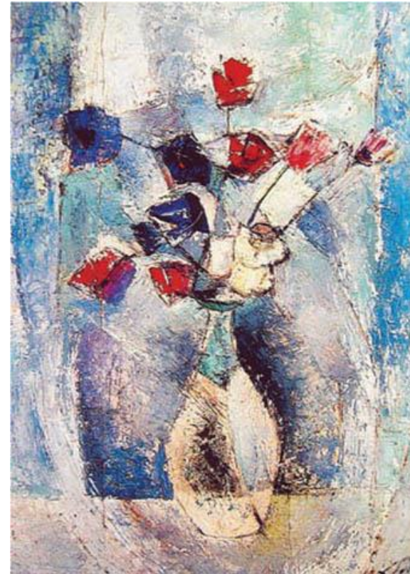
รูปภาพที่ 2.4 องค์ประกอบของทัศนธาตุ

ส่วนสำคัญที่รวมกันเป็นรูปร่างของสิ่งทั้งหลายตามที่มองเห็น เป็นส่วนประกอบสำคัญของศิลปะที่สามารถนำมาจัดให้ประสานกลมกลืน เกิดเป็นผลงานศิลปะที่มีคุณค่าทางความงาม