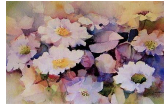
รูปภาพที่ 2.10 ภาพบริเวณ