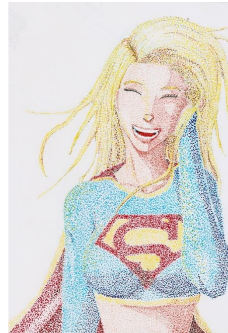
รูปภาพที่ 2.4 ภาพจุด

1. จุด คือ รอยหรือแต้มที่มีลักษณะกลมๆ ปรากฏที่ผิวพื้น ไม่มีขนาด ความกว้างความยาว ความหนา เป็นสิ่งที่เล็กที่สุดและเป็นธาตุเริ่มแรกที่ทำให้เกิดธาตุอื่น ๆ ขึ้น