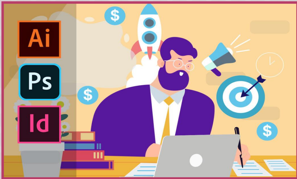
กราฟิก (Graphic Design)