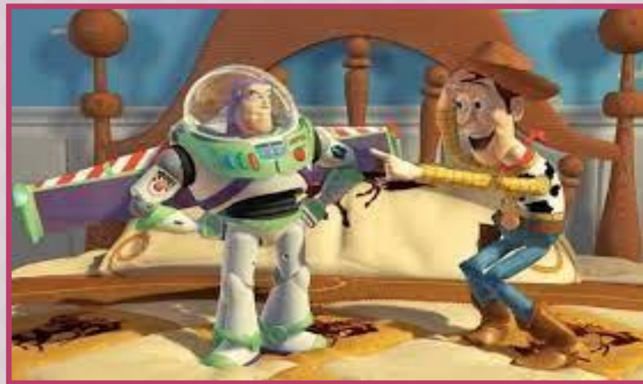
แอนิเมชัน (Computer Animation)