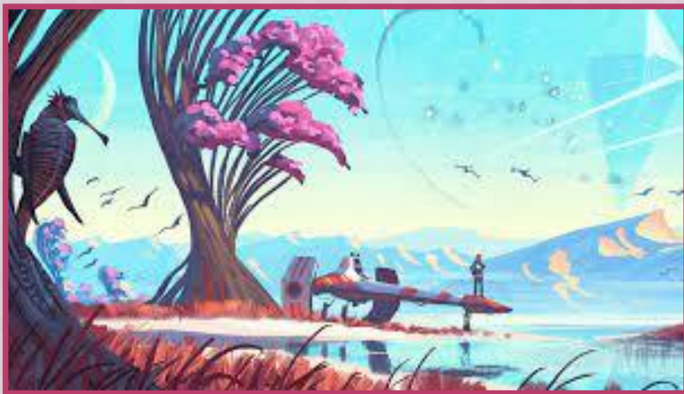
ดิจิทัลอาร์ตส์ (Digital Arts)