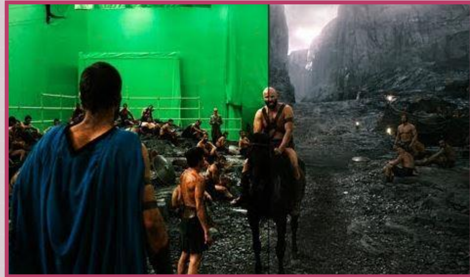
วิชวลเอฟเฟค (Visual Effects)