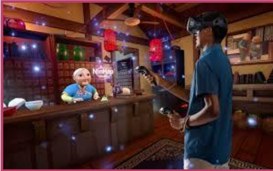
การออกแบบเกมเชิงโต้ตอบ (Interactive and Game Design)